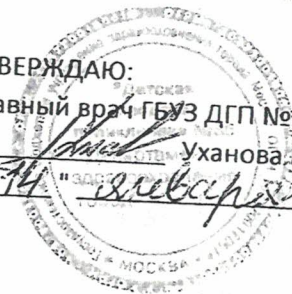
График работы медицинского персонала ГБОУ Школа № 1592